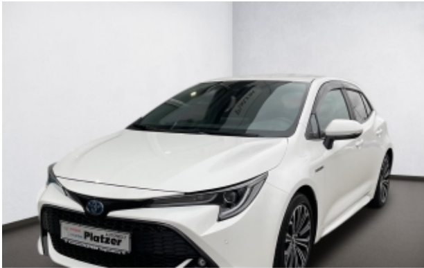
Autohaus Platzer Bekannt für guten Service! Tel.: 0941 60495-0