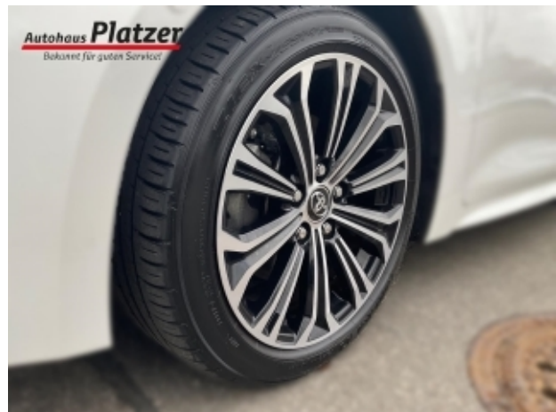
Autohaus Platzer Bekannt für guten Service!