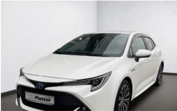
Autohaus Platzer Bekannt für guten Service! Tel.: 0941 60495-0