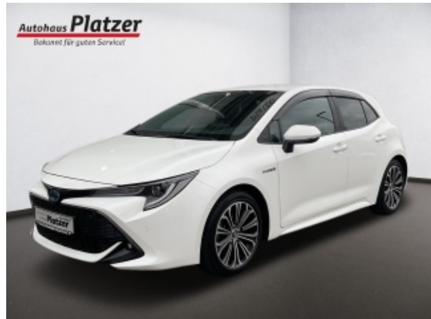
Autohaus Platzer Bekannt für guten Service!