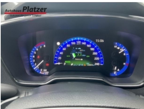
Autohaus Platzer Bekannt für guten Service!