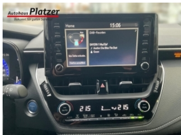
Autohaus Platzer Bekannt für guten Service!