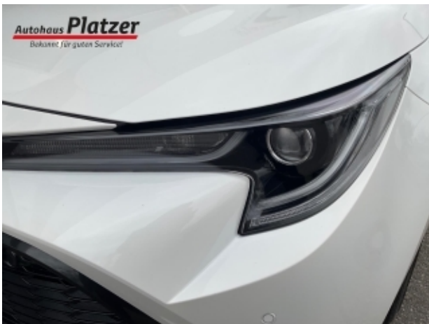
Autohaus Platzer Bekannt für guten Service!